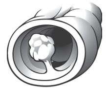
Pólipo en el colon